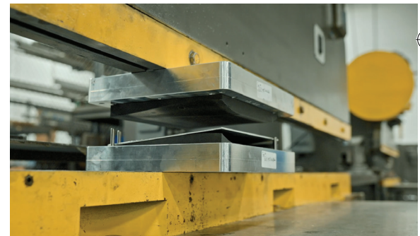
Une pièce en tôle est sur le point d'être façonnée avec les matrices imprimées en 3D.